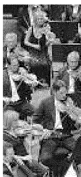
BAMBINI L'orchestra Rai, stasera all'Auditorium Toscanini